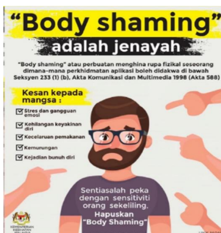
Rajah 3. Contoh poster untuk mendidik khalayak ramai.

Dalam hal ini, kerajaan Malaysia tidak hanya mengenakan hukuman ke atas pesalah sebagai pengajaran, sebaliknya pengajaran juga diberikan melalui poster bagi mendidik khalayak agar tidak melakukan jenayah siber. Jenayah siber ini digunakan oleh pengguna media sosial dalam hantaran mereka pada platform yang tertentu. Rajah 3 yang berikut memperlihatkan poster yang disediakan oleh Kementerian Kesihatan Malaysia (KKM).