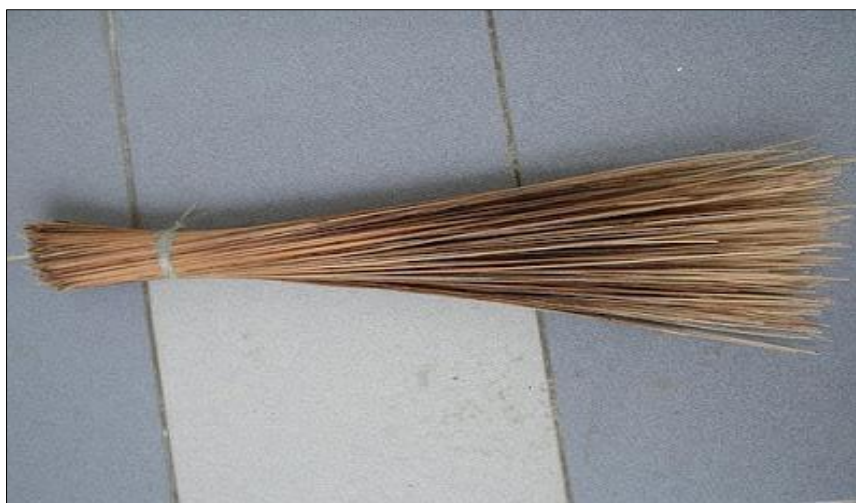
Rajah 4. Penyapu yang diperbuat daripada lidi.

Setelah menentukan kod, inferens dan andaian, proses menentukan andaian paling relevan dilakukan. Murid dibimbing untuk mengenal pasti andaian yang relevan dan sesuai. Berdasarkan andaian-andaian yang dikenal pasti, andaian pertama ialah andaian yang paling relevan kerana maklumat ini telah tersimpan dalam memori jangka panjang murid. Murid telah sedia maklum bahawa kekuatan berpasukan ialah kunci utama dalam sesuatu kejayaan. Dengan itu, murid telah berupaya mencungkil makna baris sajak ini melalui proses kognitif. Namun, makna ini belum cukup untuk merungkai makna sebenar yang dihajati oleh penyajak. Oleh yang demikian, pendekatan SI akan diaplikasikan bagi memberi ruang kepada murid menterjemahkan KBAT ke dalam bentuk penerokaan makna yang menuntut murid meneroka ilmu di peringkat multidisiplin. Pada peringkat ini, murid dibimbing menjawab persoalan 'kenapa, kenapa dan kenapa' untuk mencari makna yang dihajati. Kenapa baris sajak ini menggunakan 'lidi'? Bagi merungkai persoalan ini, pengkaji menerangkan maklumat yang berkaitan dengan lidi kepada murid. Lidi berasal daripada daun pokok kelapa yang diraut dengan menggunakan pisau. Rajah 4 menunjukkan seberkas lidi yang dijadikan penyapu.