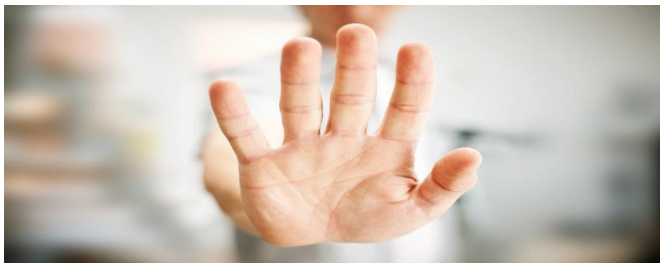
Rajah 3. Telapak tangan manusia.

peringkat ini, murid dibimbing mencari makna secara multidisiplin. Menurut Nor Hashimah (2014), pada peringkat ini, pengkaji akan dapat menjawab mengapa pola-pola yang dikatakan salah itu sebenarnya ada pewajarannya. Jawapannya pula bertepatan dengan citra dan falsafah penutur Melayu itu sendiri dan dengan ini terbongkarlah rahsia ketersiratan makna sebenar yang hendak disampaikan. Berbalik kepada ungkapan ‘tangan-tangan kami membentuk alam lestari’, kenapa ‘tangan-tangan’ dikaitkan dengan ‘membentuk alam lestari’? Dengan demikian, murid akan diberi penerangan oleh guru tentang fungsi tangan yang menjadi kekuatan fizikal kepada manusia dalam melakukan segala tugas di dunia ini. Menurut Swari (2021), satu anatomi tubuh manusia dengan fungsi yang sangat unik ialah tangan. Bahagian daripada sistem tubuh badan ini membantu pergerakan bermula daripada membawa barang, menahan benda, menggenggam dan sebagainya. Kekuatan tangan ini pula dipengaruhi oleh tulang pergelangan tangan.