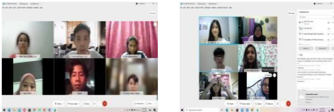
Rajah 3. Sesi FGD

Salah satu bahagian penting ialah refleksi yang merujuk proses untuk merenung, menganalisis, mencari alasan, cadangan dan tindakan untuk penambahbaikan secara berterusan. Refleksi dilaksanakan berupaya menyediakan bukti dan pengetahuan teknikal bagi meramal penyelesaian efektif serta proses penambahbaikan secara konsisten dan berterusan dalam KPS. Ketika pengimplementasian KPS, refleksi dikendalikan melalui teknik inkuiri bagi mendapatkan maklum balas daripada pelajar. Tindakan susulan perlu dilakukan sama ada melalui pemulihan atau pengayaan. Refleksi yang dikendalikan secara konsisten dan bebas membolehkan fasilitator menjangka hasil sesuatu tindakan serta membuat perancangan awal. Fasilitator juga boleh meramalkan mengenai segala perubahan dan hasil pembelajaran kerana kepelbagaian latar belakang pelajar serta keupayaan mereka sudah dikenal pasti. Bagi mendapatkan maklum balas mengenai KPS yang digunakan, FGD digunakan untuk berkongsi idea dan impak pengendalian. FGD dikendalikan dalam talian ketika aktiviti PdPc Norma Baharu. Justeru itu, penambahbaikan dalam pedagogi dan bahan PdPc juga boleh dilaksanakan bagi memantapkan lagi pelaksanaan KPS.