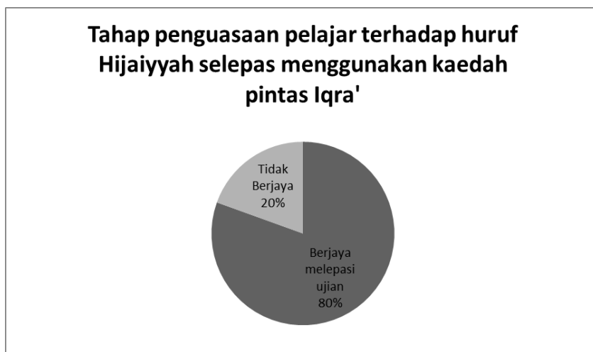
Rajah 2: Tahap penguasaan pelajar terhadap huruf Hijaiyyah selepas menggunakan kaedah pintas Iqra'

Dari rajah di atas, didapati hanya 20% murid tidak menunjukkan sebarang peningkatan dalam penguasaan huruf hijaiyyah ini. Manakala selebihnya, 80% murid mampu menguasai baris huruf hijaiyyah sama ada tunggal atau bersambung dengan baik. Pengkaji juga mendapati 2 orang pelajar daripada 20% yang tidak Berjaya di dalam ujian ini selepas menggunakan kaedah pintas Iqra mempunyai masalah kekeliruan dalam mengenal baris dan huruf-huruf yang dipamerkan, ini boleh di kaitan dengan masalah disleksia.