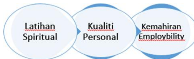
Rajah 1. Hubungan latihan spiritual dan kualiti personal