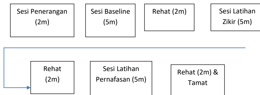
Rajah 2. Proses pengumpulan data