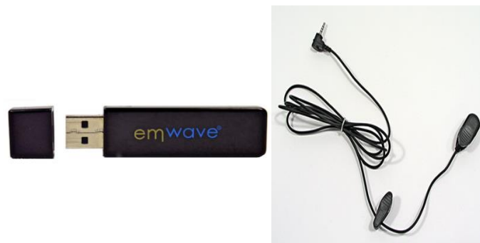
Rajah 3. Peralatan HeartMath Emwave desktop

Berikut adalah instrumen yang digunakan dalam kajian ini meliputi penggunaan peralatan HeartMath Emwave sebagai alat pengukur prestasi HRV peserta kajian.