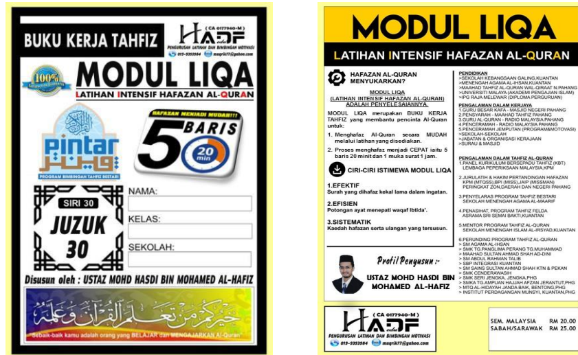
Rajah 1. Muka hadapan dan belakang modul LIQA

Mohd Hasdi (2019) menyatakan Modul LIQA (gambar 1 dibawah) merupakan akronim kepada Latihan Intensif Hafazan Al-Quran. Ianya merupakan idea yang dicetuskan oleh Ustaz Mohd Hasdi Bin Mohamed Al-Hafiz.