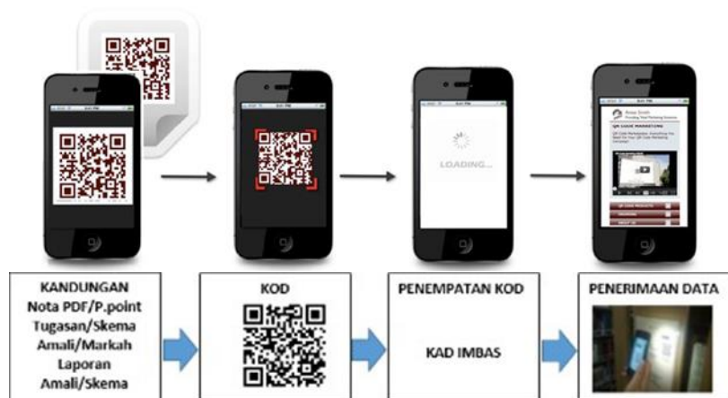
Rajah 1. Cara penggunaan Library QR Book at KKKMS

Selari dengan transformasi pendidikan yang berlaku dengan begitu pesat pada masa kini terutamanya merujuk kepada budaya pembelajaran secara atas talian, maka kajian ini dijalankan untuk mengenalpasti kesan penggunaan Library QR Book at KKKMS dari segi kemudahan membuat rujukan dan penambahan minat membaca dalam kalangan pelajar.