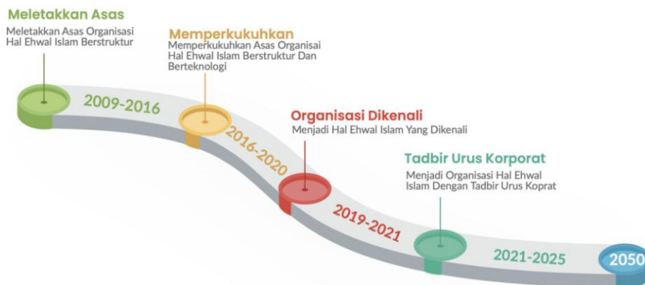
Rajah 1. Garis masa MUIP sehingga 2050

Visi MUIP ialah untuk menjadi peneraju dalam pengurusan hal ehwal Islam yang berteraskan pengurusan Rabbani menjelang tahun 2027. Visi ini menggambarkan tekad MUIP untuk menerajui transformasi dalam urusan pentadbiran Islam dengan berpaksikan prinsip-prinsip ketuhanan dan berorientasikan keberkatan. Selaras dengan visi tersebut, misi MUIP pula adalah untuk melestarikan pengurusan dan perkhidmatan hal ehwal Islam yang berkualiti melalui pengetahuan dan amalan penghayatan Islam dengan budaya kerja yang efektif serta efisien. Misi ini menekankan keperluan untuk mewujudkan budaya organisasi yang berasaskan nilai-nilai Islam dalam setiap aspek pengurusan dan pelaksanaan program. Sebagai panduan nilai organisasi pula, MUIP berpegang kepada empat nilai bersama utama iaitu Jati Diri Juara, Amanah, Integriti, dan Profesionalisme. Nilai-nilai ini bukan sahaja menjadi teras kepada budaya kerja dalam organisasi, malah menjadi asas dalam menjalin hubungan dengan masyarakat dan semua pihak berkepentingan. Moto “Hidup Bertakwa” yang dipegang oleh MUIP pula menyerlahkan matlamat akhir segala usaha dan inisiatif yang dijalankan iaitu untuk melahirkan masyarakat yang bertakwa dan sejahtera menurut panduan Islam.