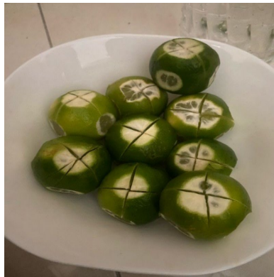
Gambar 1. Limau nipis yang telah siap dipotong

Kaedah membelah limau nipis dilakukan dengan tujuan untuk memutuskan gangguan jin daripada pesakit. Limau nipis yang digunakan mestilah limau nipis yang telah cukup matang dan segar yang boleh diperolehi oleh pesakit dari kedai atau pasar raya. Limau nipis akan dipotong di bahagian atas, bawah, kiri, kanan, depan, belakang dan tengah. Limau nipis yang telah siap dipotong akan disusun di dalam pinggan dan dibacakan surah Al-Fatihah, Al-Ikhlas, Al-Falaq, An-Nas dan ayat Kursi dengan bilangan sekali beserta dengan doa dalam bahasa Melayu. Bacaan doa yang dibacakan seperti “Ya Allah jadikan mandian limau nipis dan air minuman ini, sebagai pemutus bagi segala gangguan jin yang mengganggu pesakit dan ampunkan segala dosa-dosa pesakit dan kedua ibu bapanya.”