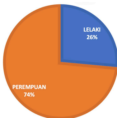
Rajah 1. Komposisi jantina

Seramai 34 responden terlibat menjawab borang soal selidik. Majoriti responden adalah perempuan (25) dan 26 responden berumur 41 tahun dan ke atas. Manakala, sekitar 65% daripada responden ini berpendapatan bawah dari RM1,500. Rajah 1-3 dan Jadual 1 menunjukkan demografi responden.